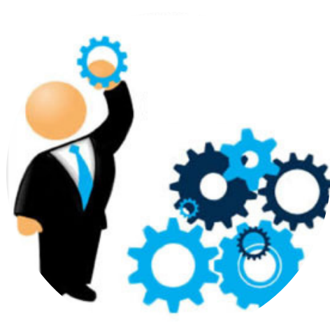
Executa as leis