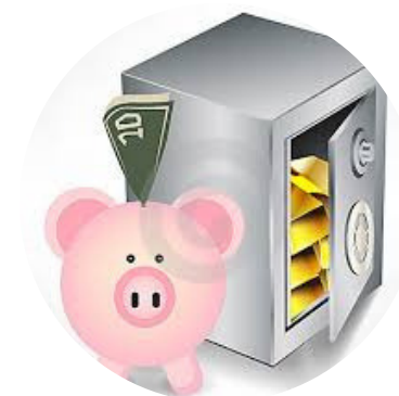
Gerencia as verbas públicas

Para gerenciar as verbas, deve encaminhar ao Poder Legislativo, até julho de cada ano, um projeto contendo a Lei de Diretrizes Orçamentárias, estabelecendo as despesas e receitas para o ano seguinte.