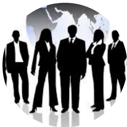
Cria as Políticas Públicas